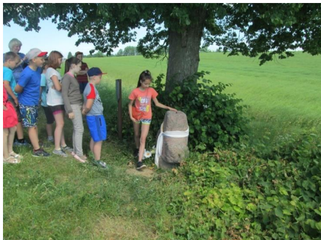
Фота 7. Палачанскі цудадзейны камень