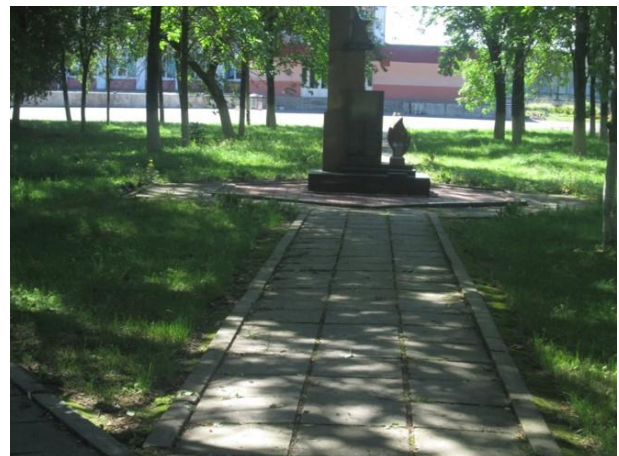
Фота 5. Помнік землякам