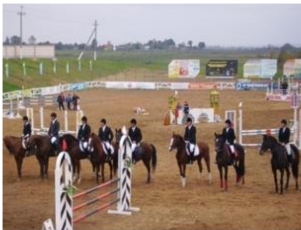
Фота 4. Конна-спартыўны комплекс “Палачаны”