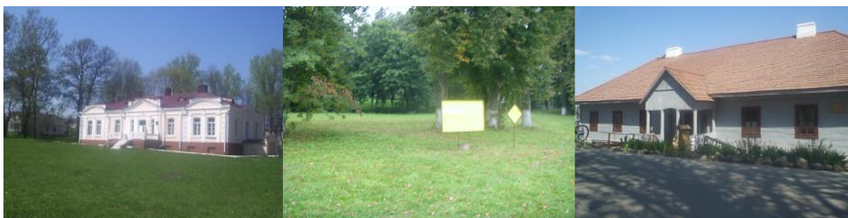
Фота 8. Сядзібна-паркавы комплекс “Яхімоўшчына”