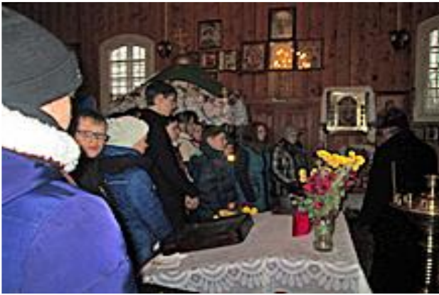
Фота 1. Груздаўская царква