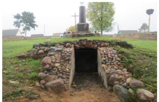
Фота 2. Складзенне Ходзбкаў-Дадэркаў