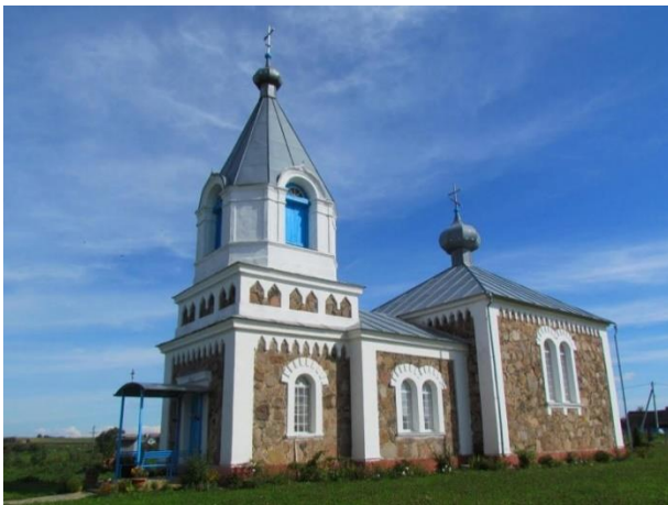
Фота 3. Палачанскія святыні (царква святой Багародзіцы і касцёл святога Роха)