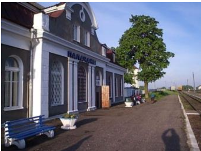
Фота 6. Чыгуначны вакзал ст. “Палачаны”